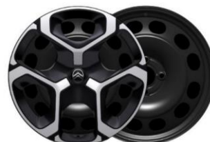
Enjolveurs 17" AZURITE