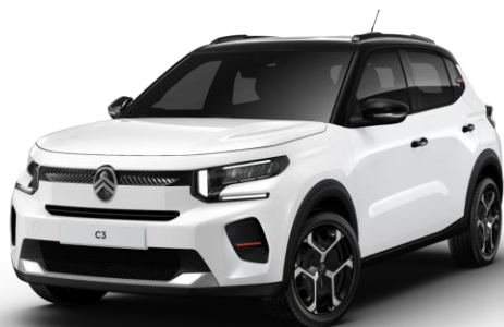
Blanc Banquise – toit Noir Perla Nera (O*) Color Clips Infra Rouge