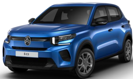
Bright Blue (O)