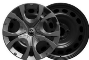
Enjolveurs 16" PYRITE