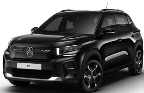
Noir Perla Nera – monoton (O) Color Clips Blanc