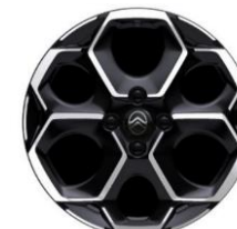
Jantes alliage 17" ATACAMITE Diamantées

● Série ○ Option # Réservée aux sociétés