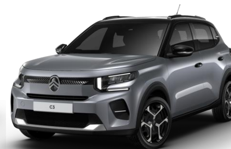
Gris Mercury – toit Noir Perla Nera (O*) Color Clips Blanc