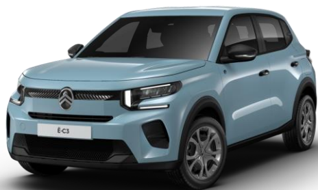
Bleu Monte Carlo (●)