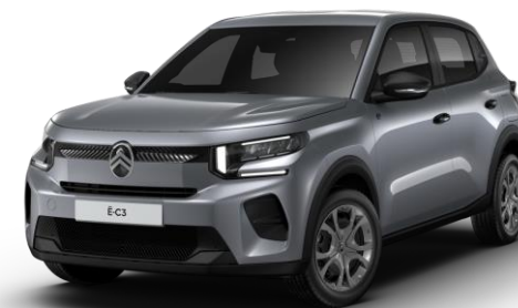
Gris Mercury (O)