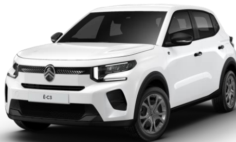
Blanc Banquise (O)