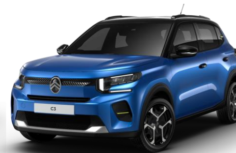
Bright Blue – toit Noir Perla Nera (O*) Color Clips Yellow Lemon