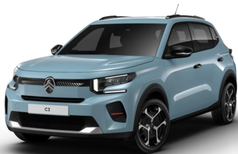
Bleu Monte Carlo – monoton (●) Color Clips Infra Rouge