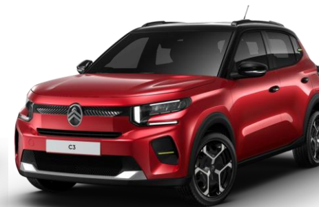
Rouge Elixir (1) – toit Noir Perla Nera (O*) Color Clips Yellow Lemon

● Série ○ Option * Option Toit biton non disponible sur la finition Business (1) Peinture spéciale nacrée vernis teinté # Réservée aux sociétés