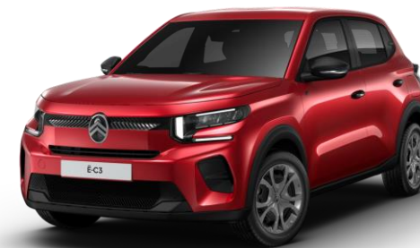
Rouge Elixir (1) (O)

● Série ○ Option (1) Peinture spéciale nacrée vernis teinté