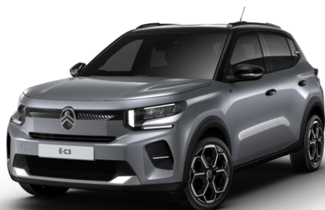
Gris Mercury – toit Noir Perla Nera (○) Color Clips Blanc