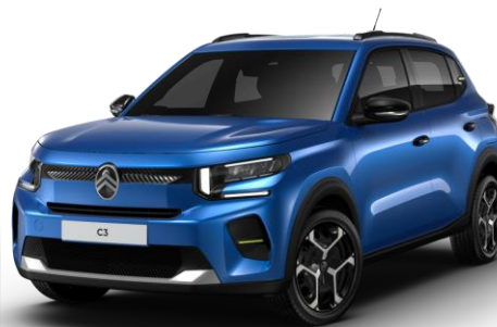
Bright Blue – monoton (O) Color Clips Yellow Lemon