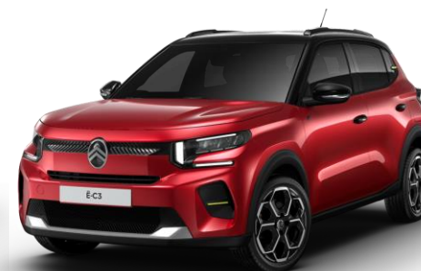
Rouge Elixir (1) – toit Noir Perla Nera (○) Color Clips Yellow Lemon