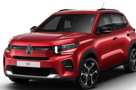
Rouge Elixir (1) – monoton (O) Color Clips Yellow Lemon