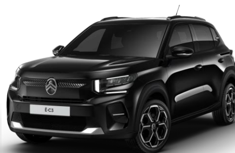
Noir Perla Nera – monoton (○) Color Clips Blanc