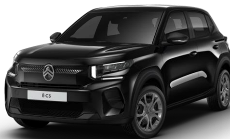
Noir Perla Nera (O)