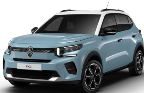
Bleu Monte Carlo – toit Blanc Opale (●) Color Clips Infra Rouge