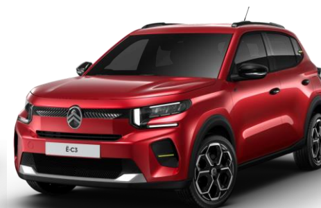
Rouge Elixir (1) – monoton (○) Color Clips Yellow Lemon

● Série ○ Option (1) Peinture spéciale nacrée vernis teinté