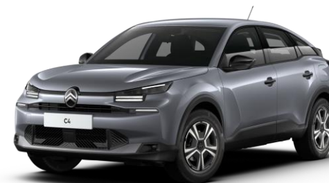
Gris Mercury (O) métallisé