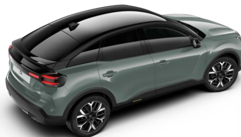
Manhattan Green – toit Noir Perla Nera (○)