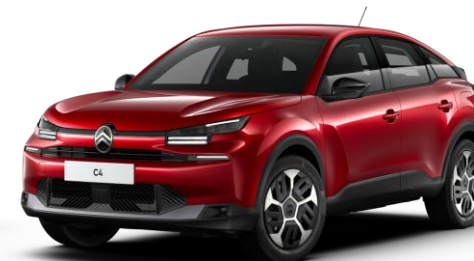
Rouge Elixir (○) nacré avec vernis coloré