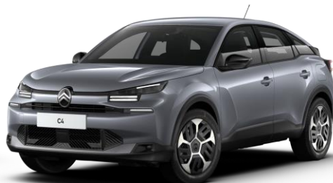
Gris Mercury (○) métallisé