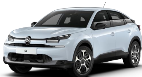
Blanc Okenite (○) métallisé