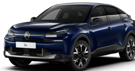
Blue Eclipse (○) métallisé