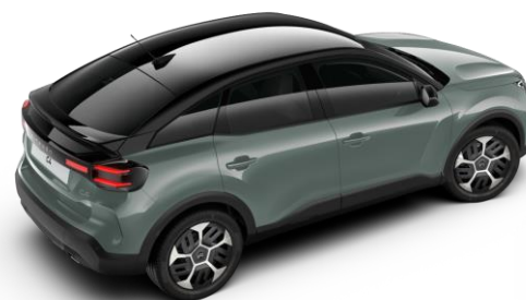
Manhattan Green – toit Noir Perla Nera (○)