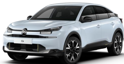
Blanc Okenite (○) métallisé