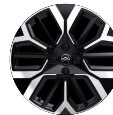
Jantes alliage 18" AMBER Diamantées

● Série ○ Option # Réservée aux sociétés