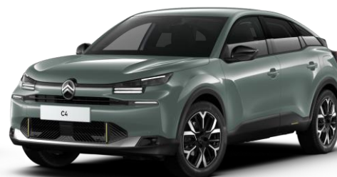
Manhattan Green (○) opaque