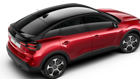
Rouge Elixir – toit Noir Perla Nera (○)