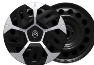
Enjoliveurs 18" AEROTECH