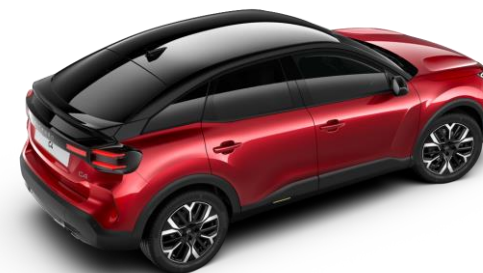
Rouge Elixir – toit Noir Perla Nera (○)

● Série ○ Option # Réservée aux sociétés