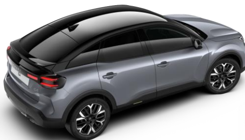
Gris Mercury – toit Noir Perla Nera (○)