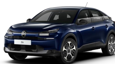
Blue Eclipse (○) métallisé