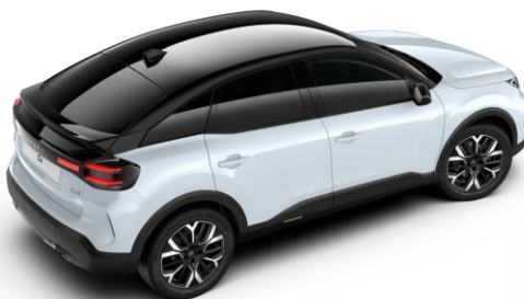
Blanc Okenite – toit Noir Perla Nera (○)