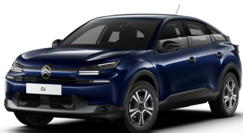
Bleu Eclipse (O) métallisé