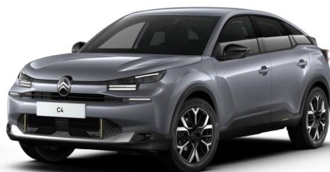
Gris Mercury (○) métallisé