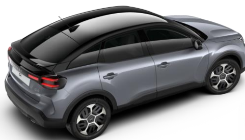
Gris Mercury – toit Noir Perla Nera (○)