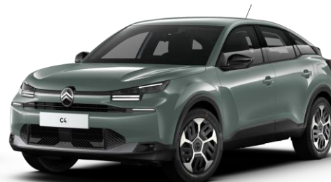
Manhattan Green (○) opaque