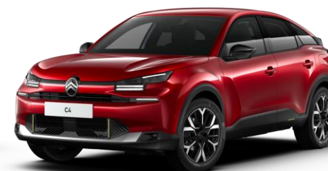
Rouge Elixir (○) nacré avec vernis coloré