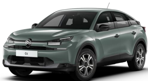
Manhattan Green (O) opaque