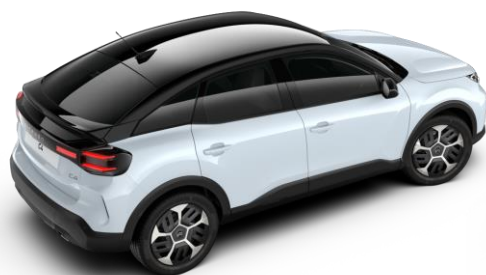
Blanc Okenite – toit Noir Perla Nera (○)