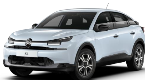
Blanc Okenite (O) métallisé