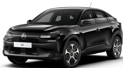
Noir Perla Nera (●) nacré