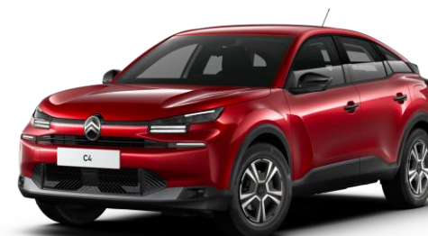
Rouge Elixir* (O) nacré avec vernis coloré