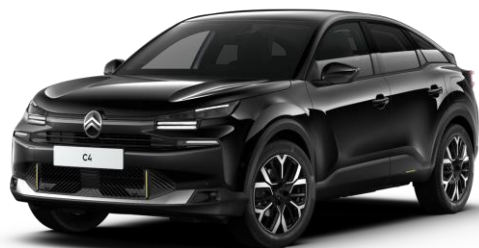
Noir Perla Nera (●) nacré