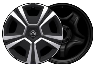
Enjoliveurs 16" STEEL & DESIGN